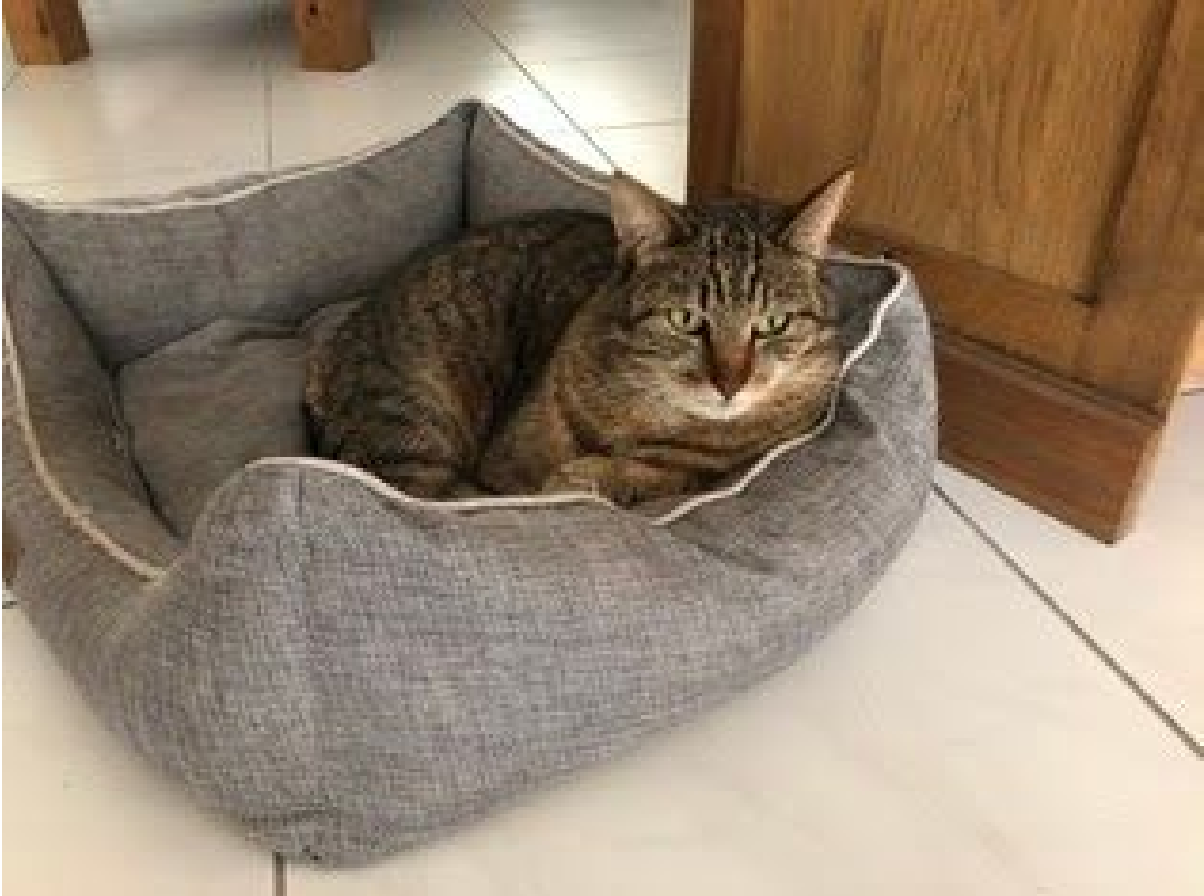
Bild: Meine Katze Simba in seinem Körbchen

Als ich unseren alten Katzenbaum betrachtete, wurde mir sehr schnell bewusst, dass ich einen neuen Katzenbaum bauen wollte. Ich habe mir diverse Modelle angeschaut und mich entschieden bei meinem Projekt einen Katzenbaum zu bauen. Mein Ziel ist es, dass meine Katze Simba ein schönes grosses Zuhause hat, in welchem er sich wohlfühlt.