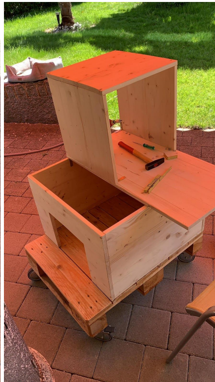
Katzenbaum mit Haus und Liegefläche