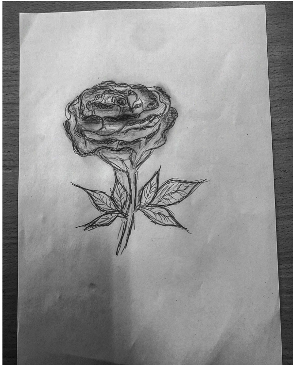
Meine zweite Zeichnung